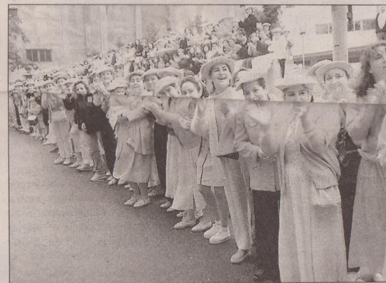
En la compañía que reivindica la presencia de las mujeres se incluyeron bastantes hombres. En la otra imagen, ovaciones femeninas para las compañías tradicionales.

E L día de San Marcial, la gran jornada festiva de la ciudad de Irún, no estuvo exento de tensiones, pero cada cual vivió la fiesta a su manera y a la postre todos consideraron que su celebración, precisamente la suya, había sido la mejor. La división nunca puede ser noticia positiva, pero sí ha de celebrarse que las cosas no fueran a mayores, aunque queda pendiente esa complicada solución que satisface a todos.