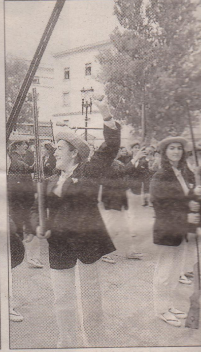
El desfile tradicional a su paso por el Paseo Colón, arriba a la izquierda, y por la avenida de Iparralde; abajo, un aspecto del desfile de la alegría de una de las componentes de la nueva compañía, tras finalizar el recorrido.