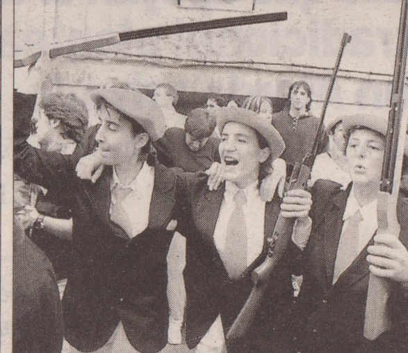
Mandos y cantineras en la campa junto a la ermita de San Marcial. Tres componentes de la compañía de mujeres dan muestras de alegría tras su desfile.