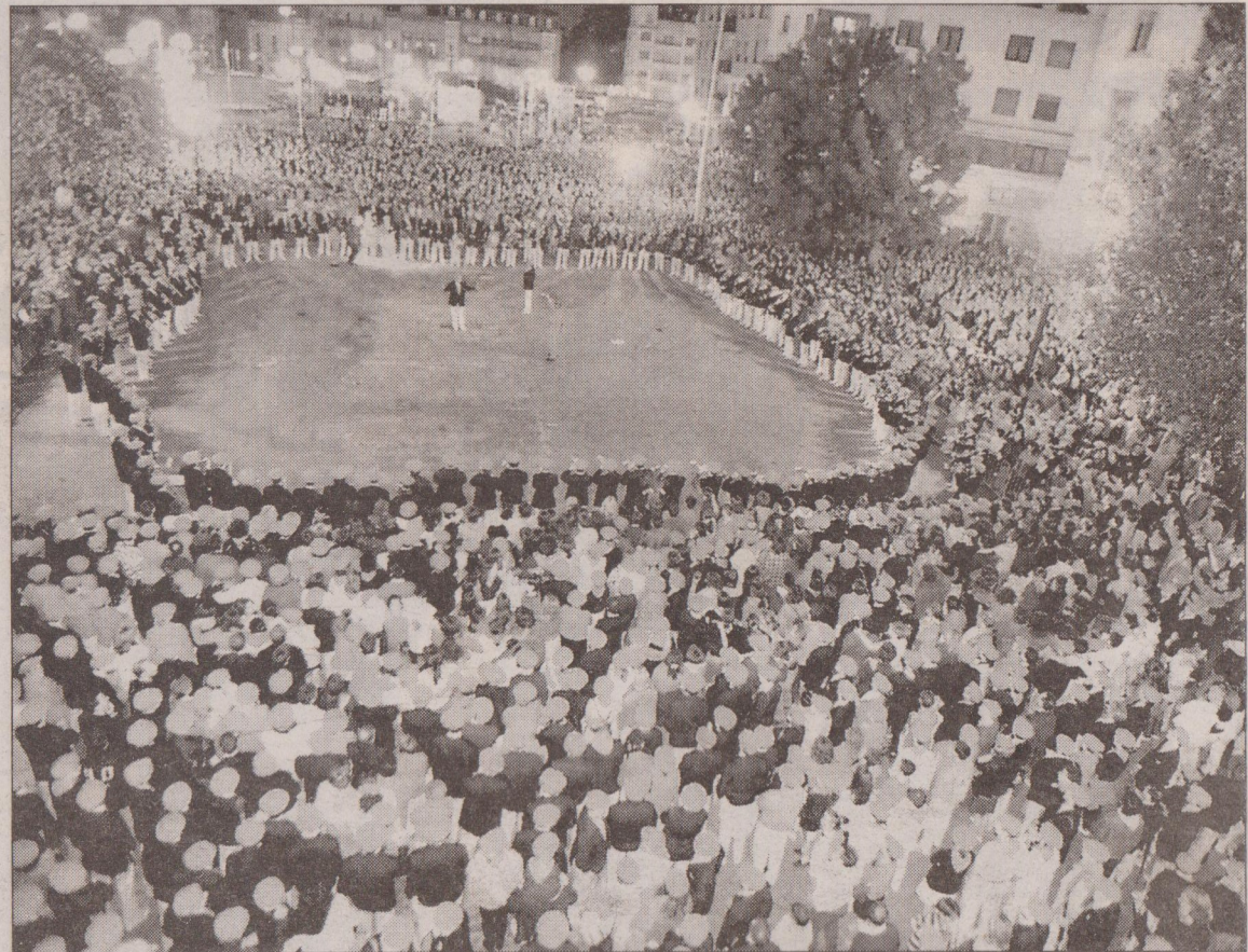
La plaza de San Juan estuvo abarrotada de público para asistir a la diana.

Pero aunque la sentencia otorgue la razón a las mujeres, nada anima a pensar que esa será la solución al conflicto después de lo sucedido este año con la organización de un Alarde alternativo. Si la mayoría del pueblo se decidiese por esto último se podría incluso barajar la posibilidad de la suspensión definitiva del Alarde oficial, el que ahora depende del Ayuntamiento. El pensamiento de muchos irundarras, al que ahora además se han unido acciones contra