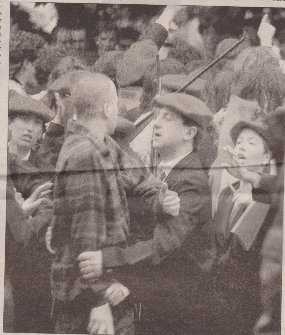
Forcejeo entre un joven contrario a la presencia de mujeres y un miembro de la nueva compañía.

ordenó la única silería en la plaza una parada que ya el recorrido oficial s años. La organi-