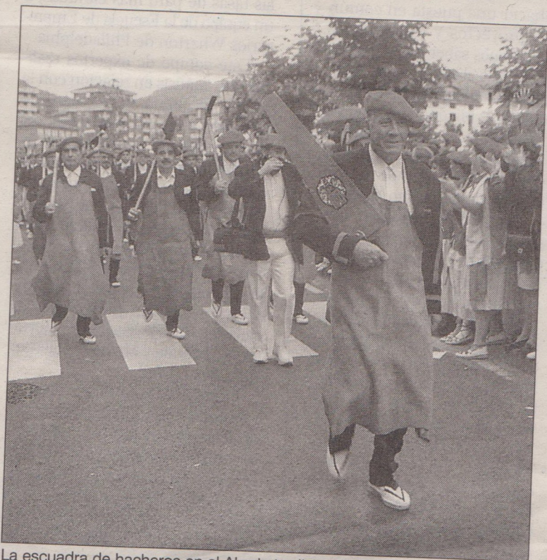
La escuadra de hacheros en el Alarde tradicional del pasado año.

En la misma nota, los defensores del Alarde tradicional consideran que la muestra de armas respaldada por el Ayuntamiento «es una clara burla hacia lo que representa el Alarde para el sentir popular» y concluyen señalando que su único objetivo es «mantener el legado de nuestros antepasados y el sentir mayoritario de nuestro pueblo. Por todo lo expuesto, exigimos el mismo respeto y consideración que nosotros estamos demostrando».