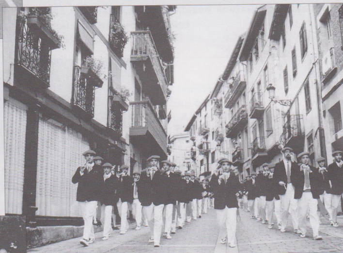
Ama Shantalen konpainia, Larretxipi kalean, goizeko Alarde alternatiboa amaiatu ondoren.