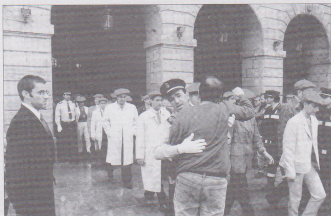
Mezaren ondoren, zenbait pertsona txistuka aritu zen eta azkenean zinegotziek ez zuten Agurra dantzatu. Benetan lotsagarria han gertaturikoa.

San Pedro eguneko goiz hartan gatazta piztu zen. Argazkian ikus daitekeenez, Alardean emakumerik nahi ez zuen pertsona bat karraxi egin zuen bere udal batza- ren eraakiaren ezadostasuna agertzeko.